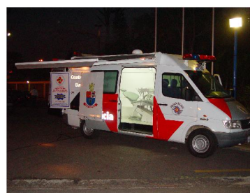
Unidade Móvel Odontológica

Capital: CCB - Centro, CPA/M-5 – Rio Pequeno, CSM/MM – Santana, C Méd – Barro Branco, 1ºBPChq – Luz, 17ºBPM/M – Mogi das Cruzes, 18ºBPM/M – Freguesia do Ó, 25º BPM/M – Itapeverica da Serra , 27ºBPM/M – Grajaú e 30ºBPM/M – Mauá.