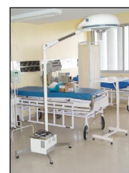
Mesas e Foco Cirúrgico