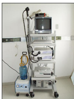
Aparelho de Endoscopia