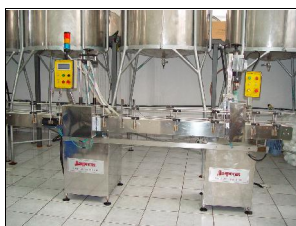
Equipamento Semi-Automático Dosar Rosquear

Já na área de farmácia o que a PRÓ-PM tem oferecido são equipamentos que visam ampliar e diversificar a capacidade de produção do Centro Farmacêutico, além de insumos para a manipulação específica quando assim prescrita. A esta altura investiu-se nesta atividade o correspondente a 14,64% (quatorze vírgula sessenta e quatro por cento) do total.