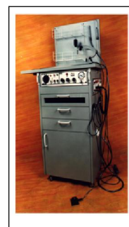
Equipamento de Otorrino