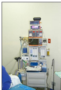
Cardioscópio de Sinais Vitais

Ao Centro Médico foi destinado o correspondente a 55,50% (cinquenta e cinco vírgula cinquenta por cento) do total, estando aí incluídos além das aquisições de equipamentos para o Hospital da Polícia Militar, outros para a Academia de Polícia Militar do Barro Branco, Escola de Educação Física, Centro de Formação de Soldados e 18º BPM/I – Presidente Prudente.