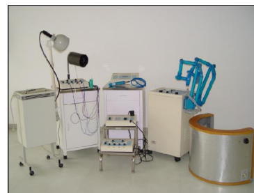
Setor de Fisioterapia